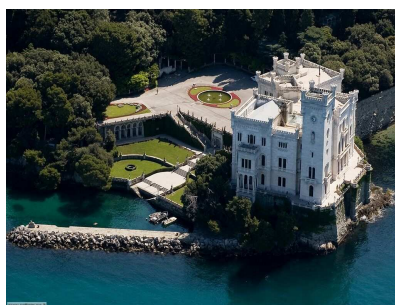
Castello di Miramare